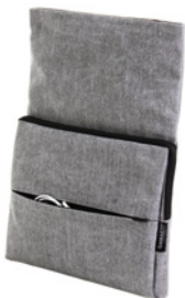
フロントポケット